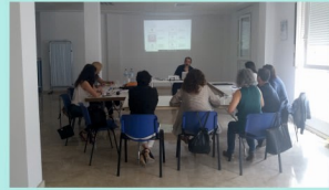
CURSOS DE FORMACIÓ

Entitat acreditada per a prestar servicis de prevenció i promoció de persones majors. Ajuda econòmica compatible amb la de cuidador a la Llei de la Dependència