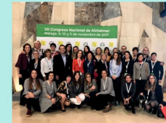
I MOLT MÉS ...